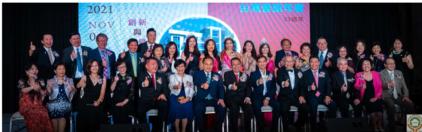
會館董事們與貴賓合影。

11月6日是大洛杉磯台灣會館的大日子，我們在聖蓋博市的San Gabriel Hilton舉辦會館的第23週年年會，當天下午有些鄉親為了參加年會怕遲到，三點開始就陸續來到會場，到了五點以後賓客雲集，擠滿會場的交誼廳。這是會館在疫情後的首次實體年會，感謝大家的熱情參與。