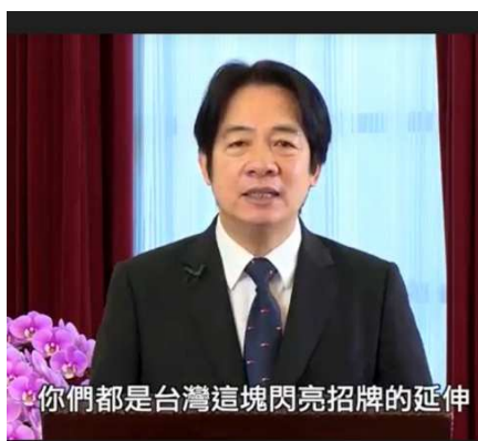
賴清德副總統錄影演說。

賴副總統在演說中，闡述台灣近年來的防疫成果、民主成就，並強調台灣是世界的台灣，台灣這股良善的力量已經向世界傳開，「民主」成為讓台灣閃耀世界的品牌。副總統也表示歡迎海