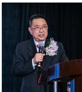
田詒鴻國策顧問致詞