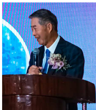
楊信國策顧問致詞