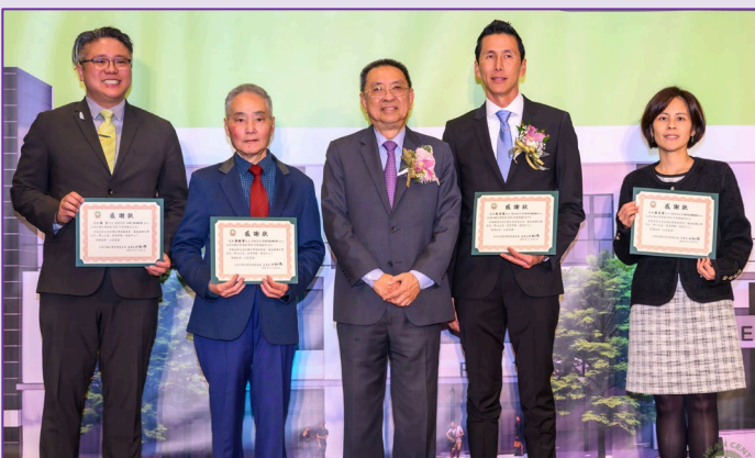
頒發 2024 榮譽顧問感謝狀

處獎、華僑文教服務中心獎、大洛杉磯台灣會館董事長獎、長榮航空公司獎以及華航航空公司獎提供給與會貴賓摸彩，恭喜獲得獎品的幸運來賓。在頒發獎品後，年會也近尾聲，在大家歡樂聲中年會圓滿結束，感謝鄉親的支持，明年年會再見！