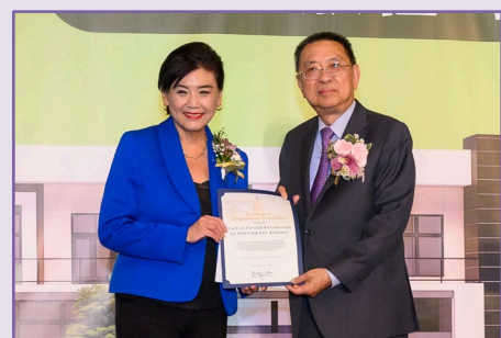
國會議員「國會亞太裔連線」主席趙美心頒發表揚狀。