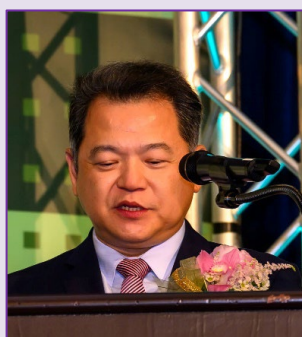
駐洛杉磯經文處處長 紀欽耀致詞