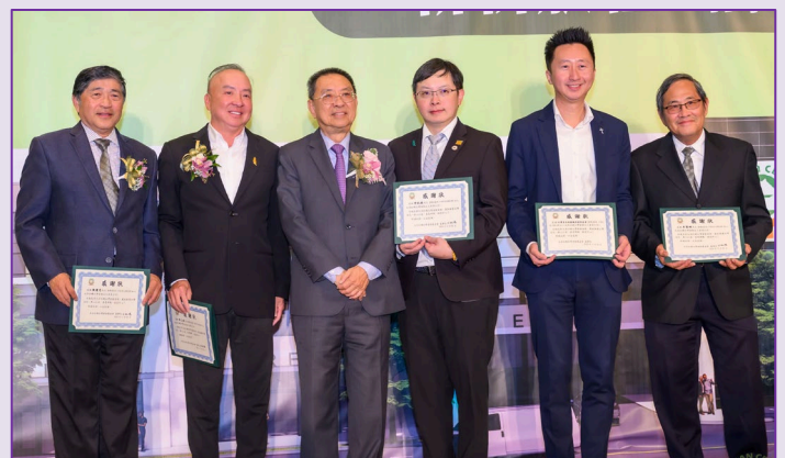
頒發 2024 永久會員感謝狀