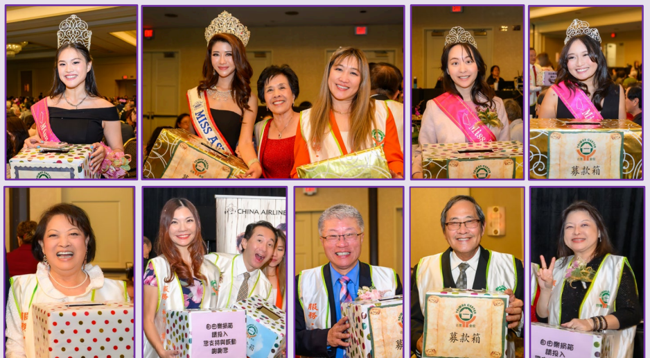
募款大軍陣容堅強

活動壓軸是由台灣智庫策略長王義川發表專題演講「台灣民主政治的挑戰」，闡述深入淺出，幽默風趣帶出嚴肅議題，大家聽得津津有味。內容涉及美國總統大選之後的台美關係、台灣國家認同、賴總統的佈局與挑戰、台灣的困境及因應、未來半年台灣的政局變數、柯文哲議題發燒的背後意義、及海外台灣人如何能為台灣效力等面向發表