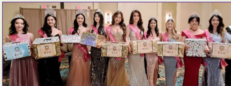
美麗大方的台美小姐除了開場秀，也拿起募款箱前往各桌募款。