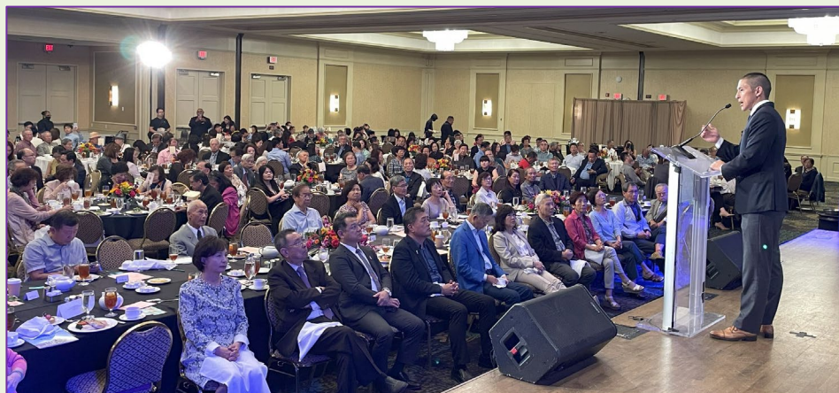
大家專注聆聽主講貴賓吳怡農演說。