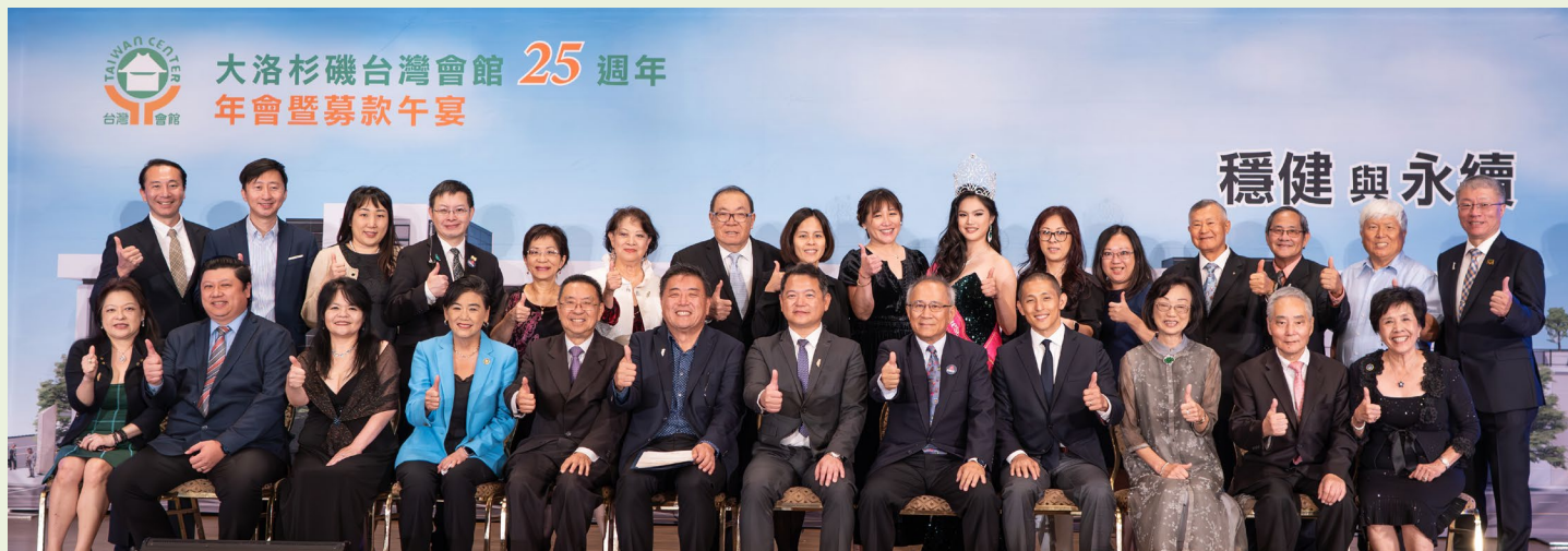
大洛杉磯台灣會館董事與貴賓合影。

10 月 15 日是會館的大日子，我們在太平洋棕櫚度假酒店舉辦 25 週年募款年會，非常感謝鄉親的支持，有 400 多位貴賓踴躍出席。