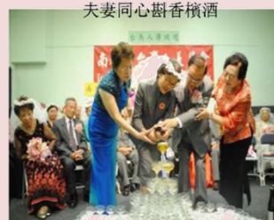
夫妻同心斟香檳酒