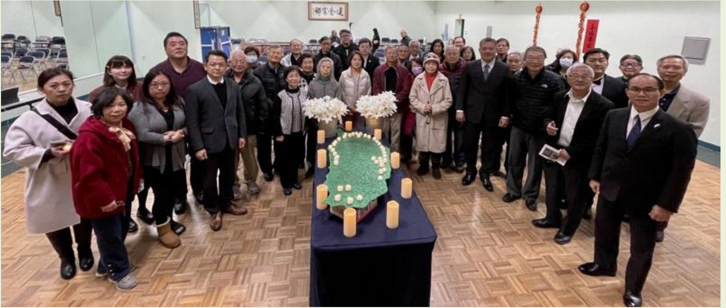
228 追思紀念會，鄉親們用燭火圍繞台灣地圖以表追思。

為緬懷並追思在「228 事件」中犧牲的台灣人，會館與台美人社團每年都會舉辦一系列的紀念活動。今年也不例外，包括參觀寬容博物館、徵 228 影片活動、追思紀念會、音樂會、228 展覽導覽活動、跨族裔防止政府暴行研討會等。以多元形式舉辦二二八紀念活動，吸引許多鄉親共同參與。