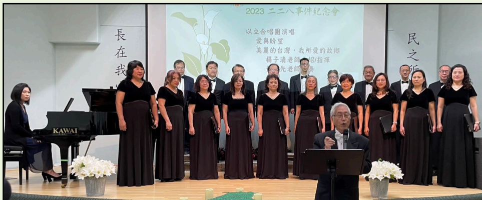
以立合唱團美妙歌聲為 228 紀念會拉開序幕。

2月25日在會館舉辦追思會，由以立合唱團演唱中揭開序幕。接著由董事長陳柏宇致詞表示，大洛杉磯台灣會館每年舉辦紀念二二八活動，目的是追思和認識過去歷史，避免慘痛歷史再次上演。他希望移民第一代至第三代台美人有機會能了解二二八歷史背景。