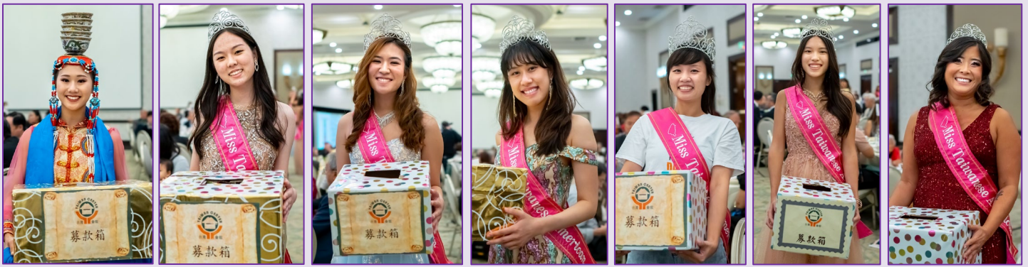
美麗大方的募款義工—2022 台美小姐