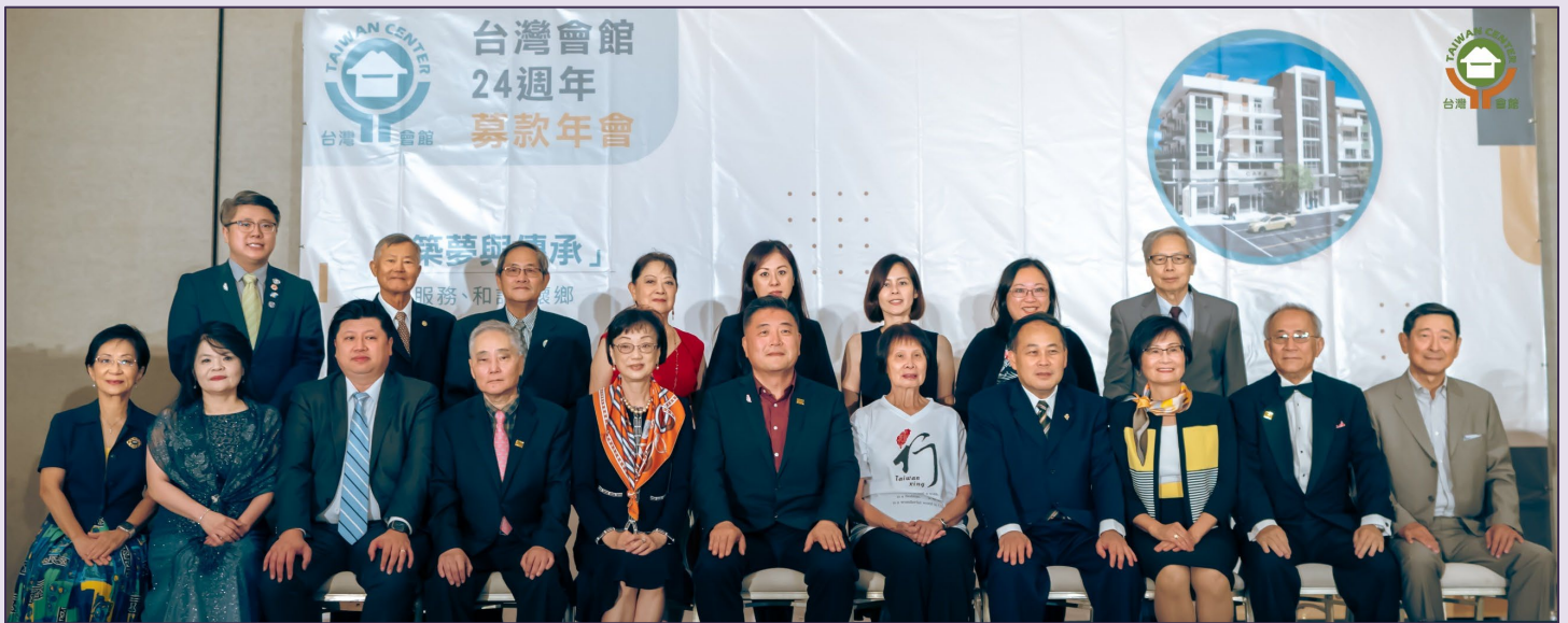
會館董事們與貴賓合影。