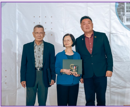
董事長頒發 2022 年榮譽顧問獎章

次符合時勢的講座。最後董事長並興奮的表示，台灣會館原地重建的前期施工規劃以及繪圖設計已步上軌道，而且進行相當順利，預計將於明年春天動工，希望新館的完工後，可以促進與新生代交流及文化的傳承。在工程方面，建館基金仍需持續募款，努力多年的目標即將實現，這次年會是重建前的最後一哩路，請大家繼續牽成。