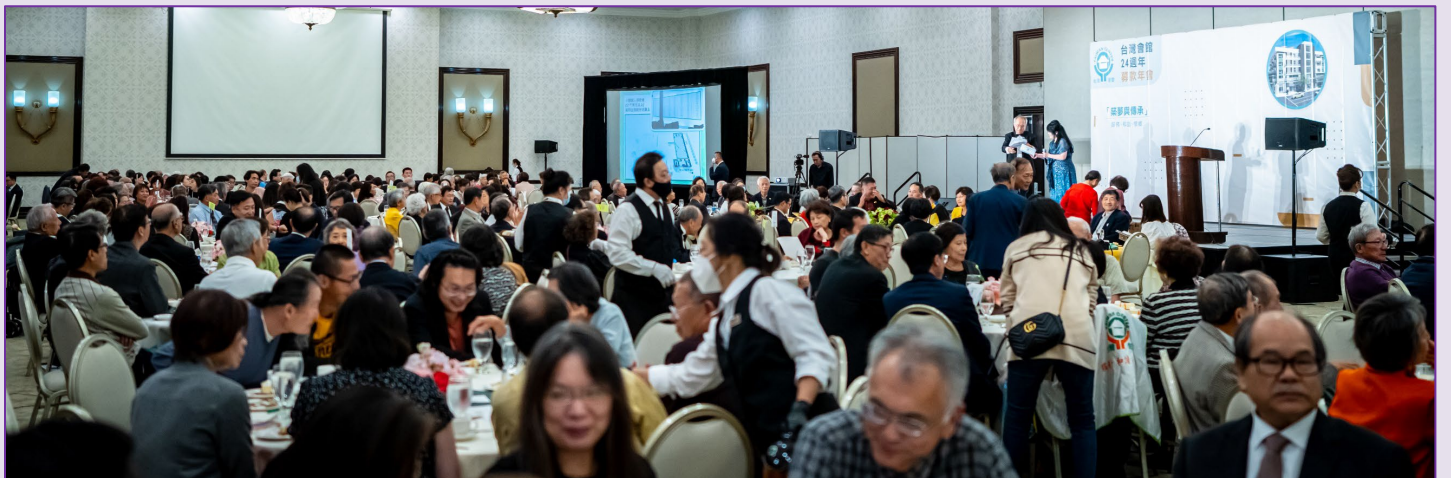
年會現場，熱鬧滾滾