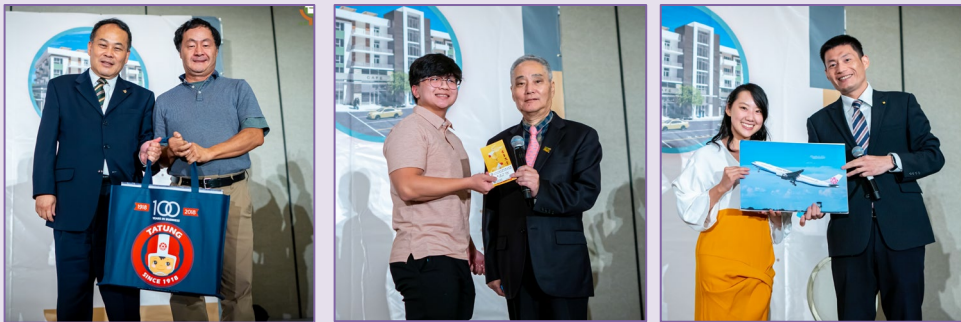
摸彩頒獎。左起：洛杉磯台北經文處獎、會館董事長獎、中華航空機票獎

年會穿插著摸彩活動，有駐洛杉磯台北經文處獎、會館董事長獎以及中華航空公司獎三個獎品提供給與會貴賓摸彩，恭喜獲得獎品的幸運來賓。在頒發獎品後，年會也近尾聲，在大家歡樂聲中年會圓滿結束，感謝鄉親的支持，明年年會再見！