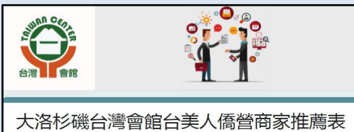
大洛杉磯台灣會館台美人僑營商家推薦表

我們期待更多台美人商家的推薦，煩請會員幫忙推薦填寫 https://t.ly/wkOo