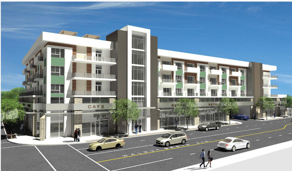
大洛杉磯台灣會館新館外觀圖。