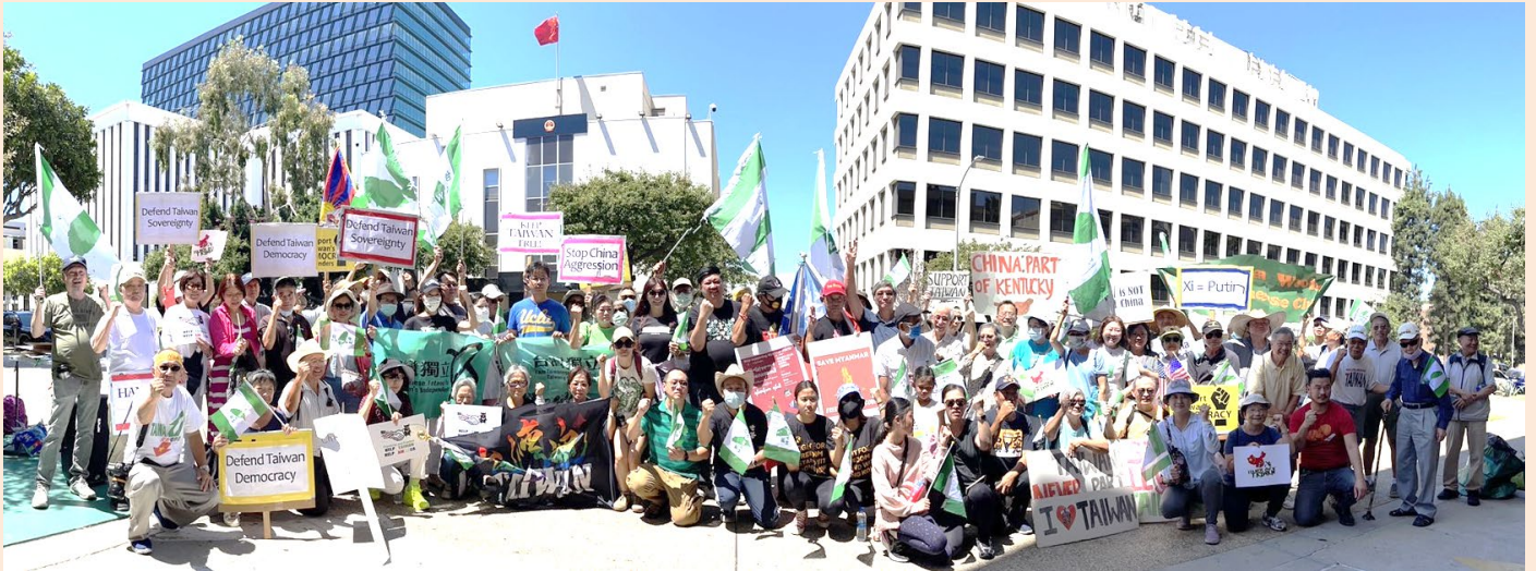
近兩百台美人為反惡霸,在中國領事館前抗議。

8月14日由大洛杉磯台灣會館、FAPA 洛杉磯分會等 20 多個社團，與一群台灣僑胞逾百人挺身而出，在中國駐洛杉磯總領事館前抗議，發起《全美連線、抗議中國霸權》大洛杉磯抗議活動，獲得來自緬甸、泰國、香港、中國等海外民主人士的聲援，共同譴責中國沒完沒了霸凌台灣，威脅亞太和平。